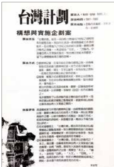
《高雄市現代畫學會 會訊》第4期，1992.7.1

中可以讀到，除了基隆漁港、屏東鵝鑾鼻燈塔、墾丁船帆石、宜蘭龜山島、雲林麥寮六輕廠和彰化八卦山大佛等具打卡地標性格的圖像外，畫面中心也都畫上了大大的圓形時鐘和指針造型，代表了前文中「時間」因素的被考量，一一用虛的時間對應實的空間，以空間的位移排比時間的流逝，在自然與人文的交疊下凝煉具南方觀點的藝術主體性。在此系列創作中，倪再沁並未完全套用他個人的「黑畫」風格，而是用一種即興的直觀揮灑、半自動的流淌與塗鴉，中和、也破解他自己的創作慣性，進而與創作當地達到人文對話的目的。不拘泥、不俗套，這是一個藝術家對自我的要求，也是倪再沁用「黑」面對台灣本土的新的詮釋和自身的關照。